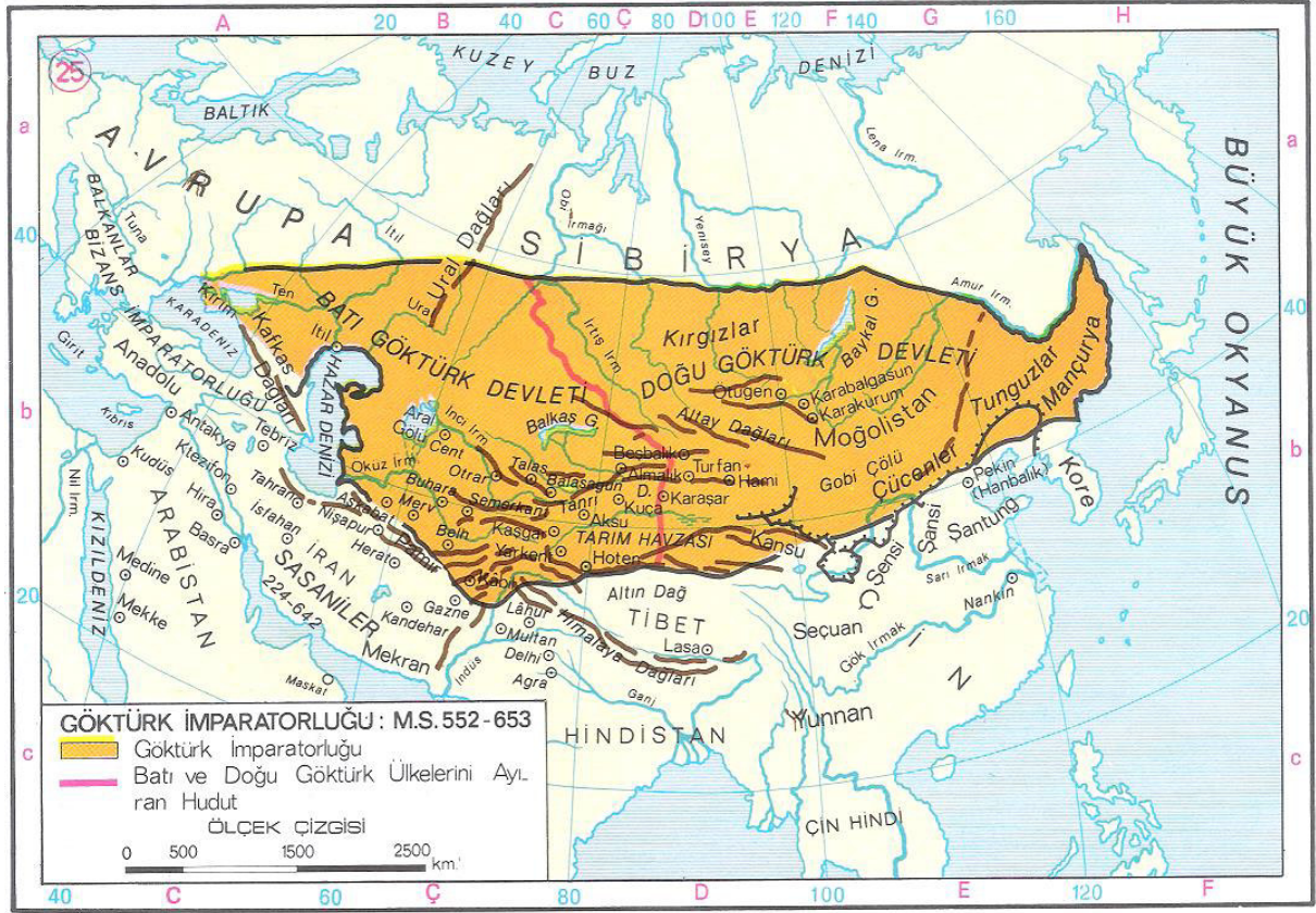
Göktürk Devleti'nin en geniş sınırlarını gösteren harita.